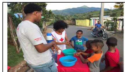
Piedra Blanca, Monseñor Nouel. Departamento de Juventud. Voluntarios de Cruz Roja Dominicana realizan campañas de prevención y difunden información sobre el correcto lavado de manos para reducir los riesgos de infección por COVID-19.